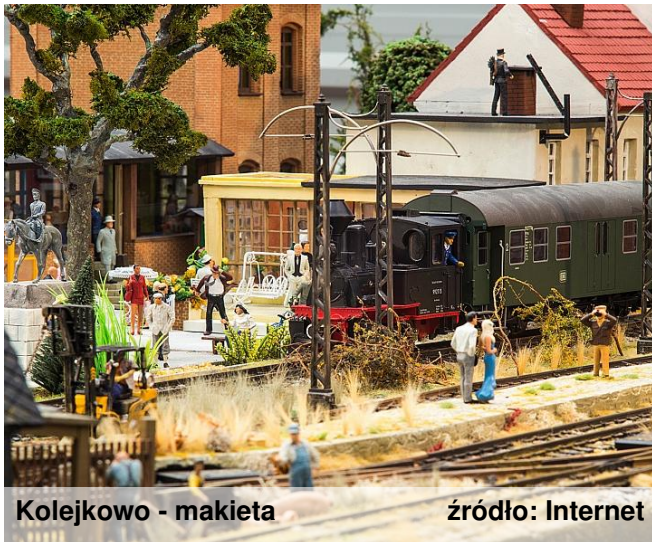
Kolejkowo - makieta

Dzisiejszą podróż po ciekawych miejscach w Polsce odbędziemy do stolicy Dolnego Śląska - Wrocławia. Jest to zabytkowe miasto położone nad Odrą. Chciałbym przedstawić Wam dwa niezwykle ciekawe miejsca, które z pewnością zainteresują dzieci i młodzież.